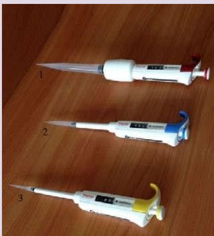
Рис. 5. Пипетки дозаторы одноканальные переменного объёма: 1 — 110 мл; 2 — 100—1000 мкл; 3 — 10—100 мкл.

Пипетка-дозатор — приспособление, используемое в лаборатории для отмеривания определённого объёма жидкости. Пипетки выпускаются переменного и постоянного объёма. В комплекты оборудования для медицинских классов входят удобные пипетки-дозаторы одноканальные, позволяющие настроить необходимый объём отбираемой жидкости в трёх различных диапазонах (рис. 6). Использование современных технологий и цветовой кодировки диапазона дозирования даёт возможность качественно, точно, безопасно выполнять пипетирование. Пипетки имеют сменные пластиковые наконечники.