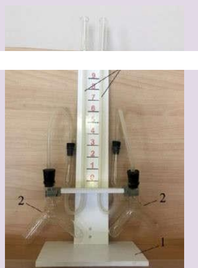
Рис. 4. Прибор для демонстрации зависимости скорости химических реакций от различных факторов: 1 — подставка; 2 — сосуды Ландольта; 3 — манометрические трубки

соединяются с сосудами Ландольта с помощью пластиковой трубки с пробками (рис. 5). Между манометрическими трубками на панели нанесена шкала для наблюдения уровня жидкости в трубках. Окрашенной жидкостью может быть раствор любого красителя в воде.