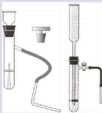
Рис. 7. Прибор для получения и собириания газов

Прибор для получения газов используется для получения небольших количеств газов: водорода, кислорода (из пероксида водорода), углекислого газа.